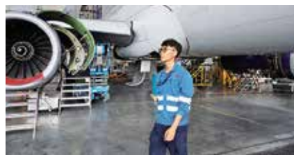
一年的實習令嘉曦更加認清目標，亦令他確信機會只會留給有準備的人，所以他會更認真提升自己的技術和知識。