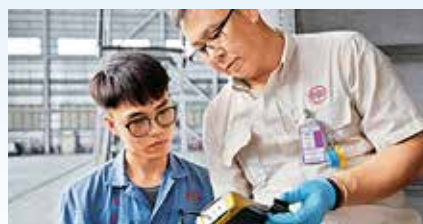
嘉曦在實習的時候跟隨不同導師工作，學習飛機不同部分的構造和運作。